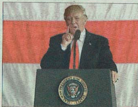
Trump, ahir després de la cimera

Trump esquiva el compromís de París en la cimera del G-7 i l'acord es limita al terrorisme